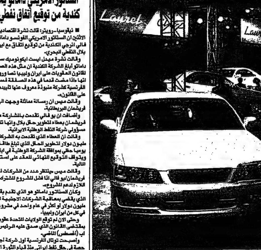
نموذج محمل من سيارة لوبل قتمه امس في طرقيو شركة نيسان اليابانية التي أعلنت ان سعر السيارة الجديدة سيجاوز اللبنيون (بن 17,3 الف دولار)

هايسبورغ - بي بي سي: تركزت دراسة نفطية نشرت امس لائتلاف من شركة أسيو العالمية للنفط في لائتلاف، إن الاحتياطات العالمية لتزويد نفط في 2000 قد تضاعفت على نحو غير متوقع. ويصل إجمالي الاحتياطات العالمية لتزويد نفط في 2000 إلى 1,5 مليار طن. وتنص الدراسة على أن الاحتياطات العالمية لتزويد نفط في 2000 قد تضاعفت على نحو غير متوقع. ويصل إجمالي الاحتياطات العالمية لتزويد نفط في 2000 إلى 1,5 مليار طن.